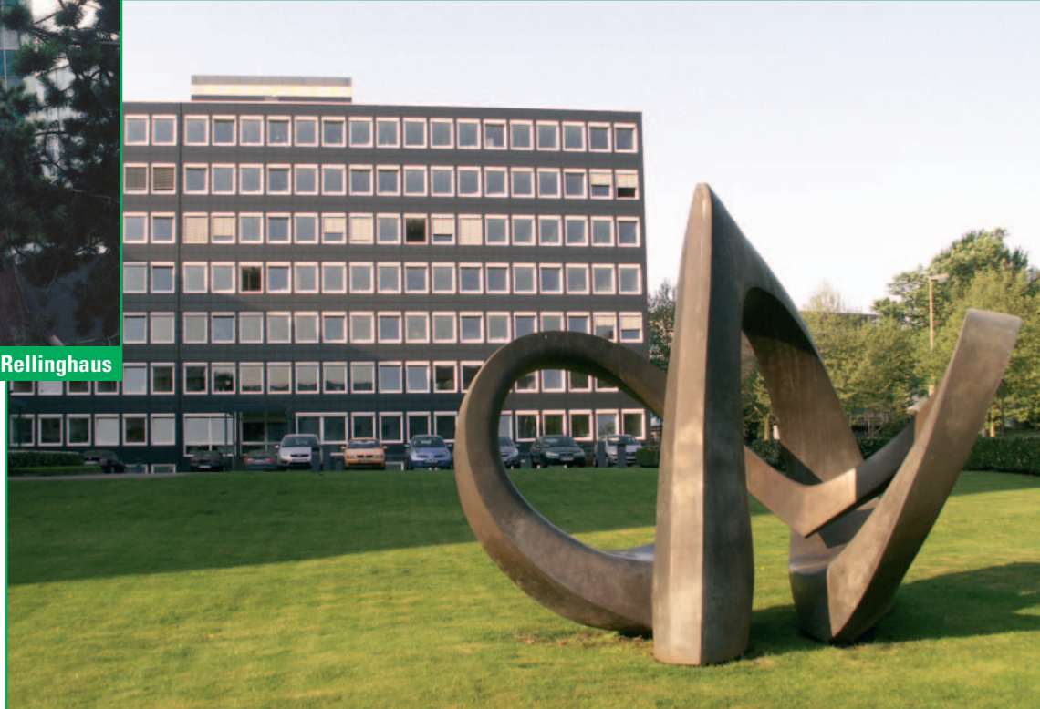
Ab August 2007 im STEAG-Haus