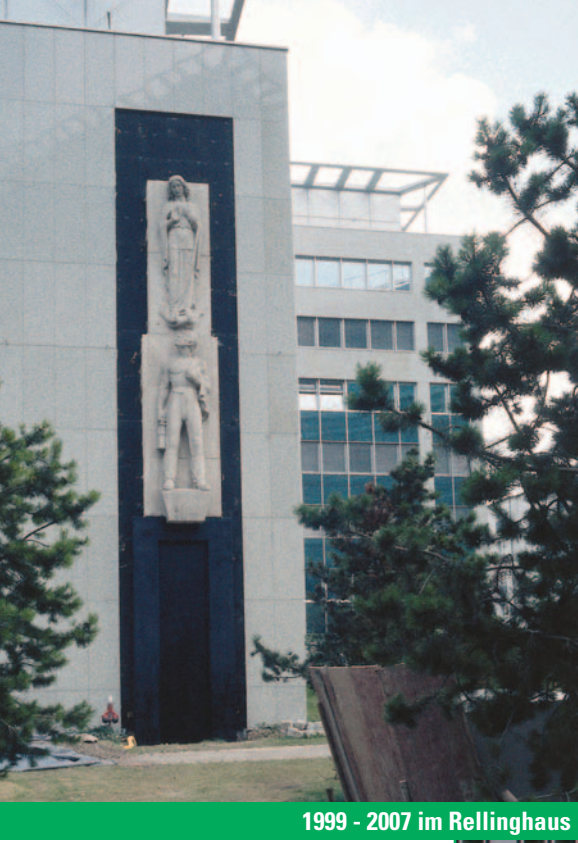
1999 - 2007 im Rellinghaus

Der Gebäudekomplex Rüttenscheider Str. 1 wurde 1956 - 60 von dem bekannten Architekten Egon Eiermann in der Tradition des Bauhausstils errichtet. Die Essener Steinkohlenbergwerke AG und die Ruhrkohle Verkauf GmbH hatten hier ihr Domizil, ebenso wie bislang die STEAG AG.