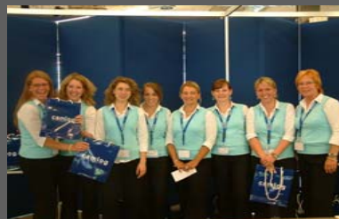
CAMLOG Vertriebs GmbH Internationaler Kongress in Montreux