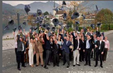
Wrigley Chicago Internationale Tagung am Tegernsee