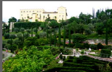
Bausparkasse Schwäbisch Hall AG Incentivereise Südtirol „Sport trifft Kultur“