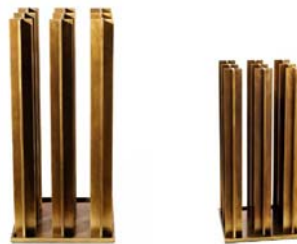
Umbrella Stand , Bassam & Fellows