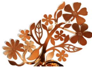
Flora , Tord Boontje