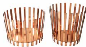
Bend , Nendo