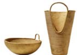
Bell Metal Objects , S. Pakhalé