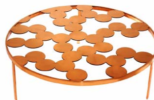
Bubble , Nendo