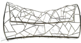
Growth , Eli Gutierrez